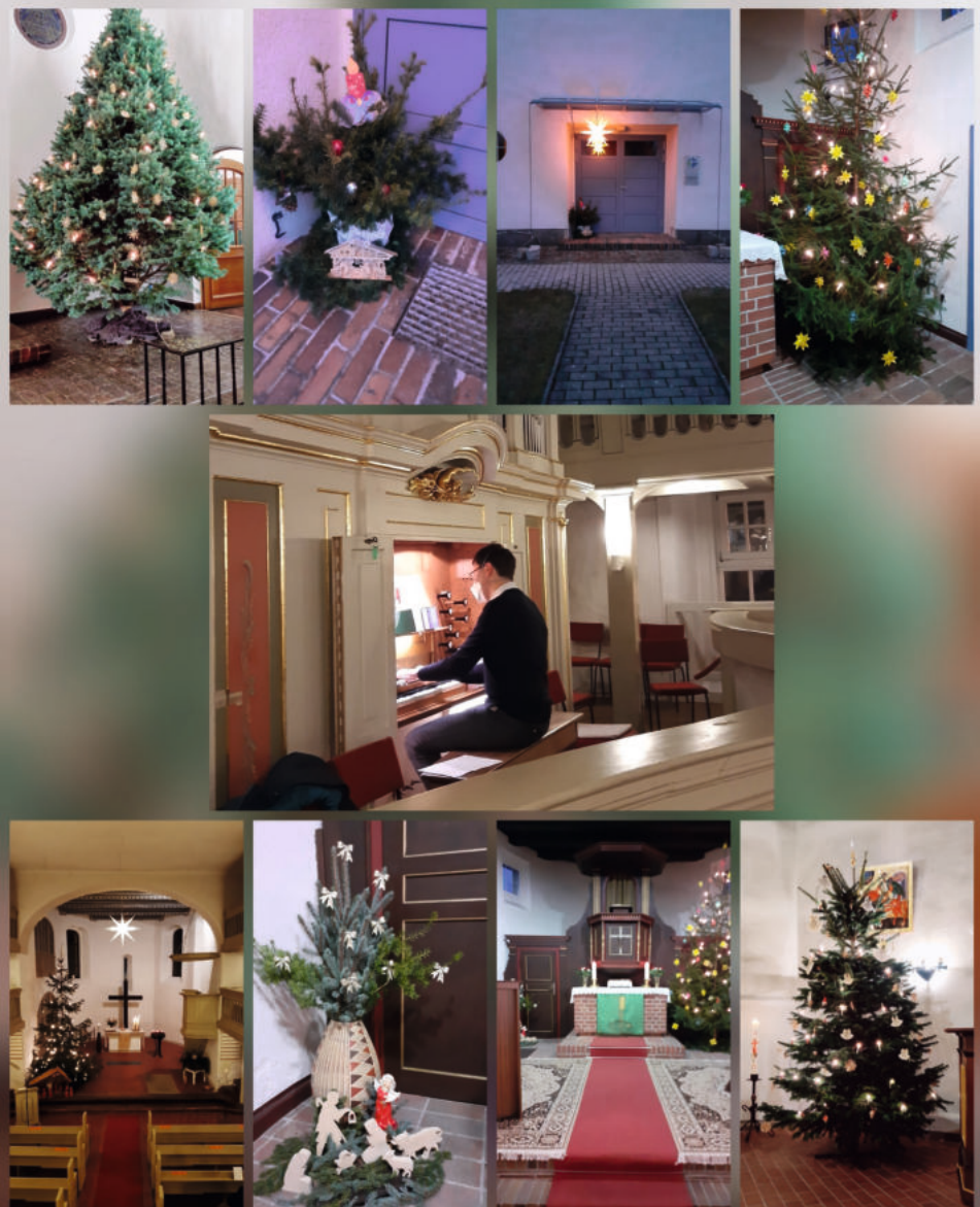
Ein paar weihnachtliche Impressionen aus unseren Kirchen. Vielleicht erkennt der eine oder andere „seinen“ Weihnachtsbaum wieder.