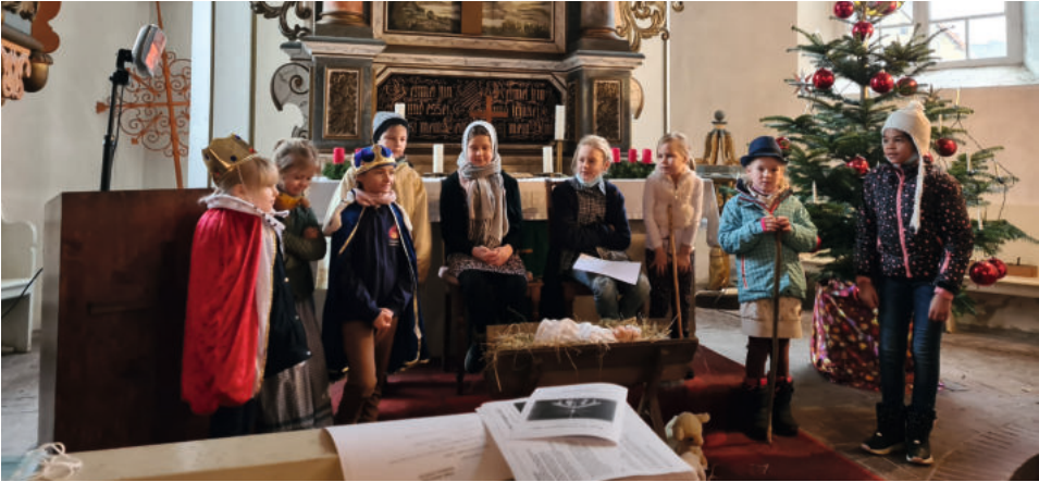
Im vergangenen Jahr gab es in den Kirchen in Lauchhammer und Schwarzheide trotz Einschränkungen Krippenspiele. Auf dem Foto sind Kinder aus Kostebrau mit ihrem Krippenspiel zu sehen.